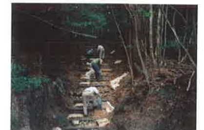
勝浦町のボランティアグループによる遍路道の補修作業

「お接待」とは、道行くお遍路さんに食事や宿などを提供することで、地域の住民が遍路を支える役割を果たした、四国遍路に特徴的な古くからの習慣です。その精神は現代にも受け継がれ、お接待の会や地域の婦人会などにより各地で行われています。また、遍路道を地域の宝物として将来に伝えたいと、草刈りや補修などを行うボランティアグループもあります。最近では遍路道を舞台としたウォーキングも盛んに行われ、お遍路さん以外の人も遍路道を歩くようになってきました。