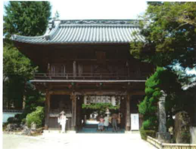
第1番札所霊山寺(鳴門市大麻町)