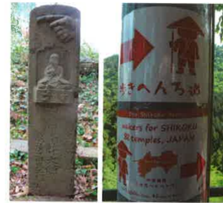
江戸時代に建てられた道しるべ(左)と、現代の道しるべ(右)