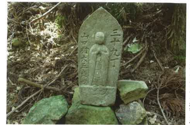
丁石 三十九丁山口村の大五良の母が建てた