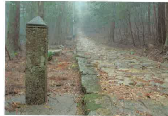
阿波遍路道「鶴林寺道」(勝浦町)