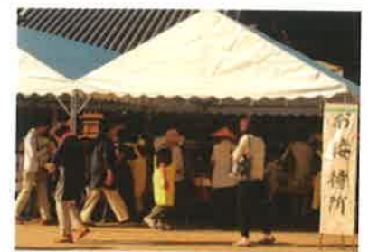
第3番札所金泉寺(板野町)でのお接待風景

現在、四国4県は四国遍路を世界遺産に登録しようと様々な取り組みを行っています。四国遍路を未来に向けて守り伝えるとともに、四国の歴史、文化を世界中に発信する取組に力を入れています。