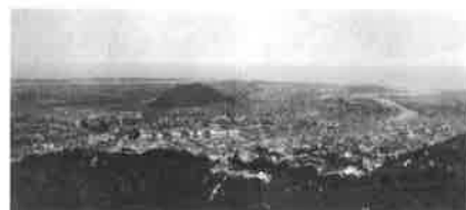
明治期の徳島市の様子

徳島藩では藍の需要が急増したことを背景に生産地と徳島城下の水上輸送の向上を図るため、5代藩主綱矩の下、吉野川本流(現旧吉野川)を分水して、別宮川(現本流)に流す計画をした。当時の別宮川や城下の支流は、 べっく 濁水期になると船の通行もままならなかったが、1672(寛文12)年に本