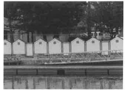
藍場浜親水公園の藍倉群のオブジェ

水量が豊かになった徳島城下の河川には、大型の船も通行できるようになり、とくに新町川の西船場町と対岸の新町船場町には、江戸と大坂をはじめ諸国の藍市場に藍玉を販売する藍商たちが郷村部から進出し、店舗や出荷前の藍を保管する倉庫が建ち並んだ。こうして吉野川流域で産出された藍玉を集積し、藩外の市場からの注文に応じて出荷できる体制を備えていった。また藍の栽培には大量の金肥(魚肥)を必要としたためその集積にも倉庫が必要であった。