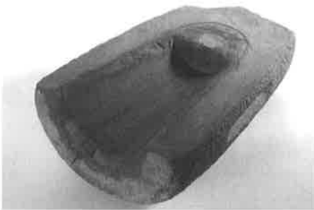
東奈良遺跡(大阪府東大阪市)出土の銅鐸石製鋳型

銅鐸は、現代の南部鉄瓶や銅鐘といった鋳物製品の製造方法と同じように、高温でドロドロに溶けた青銅を鋳型に流し込んで製造する。熱が冷めて鋳型から取り出された銅鐸は、丁寧に研磨されて金色に輝いていたであろう。鋳型には石製と土製の2種類があった。大半の鋳型は石製であるが、奈良県田原本町の からこかぎ 唐古鍵遺跡では土製の鋳型が出土している。なお、徳島県では鋳型は見つかっていない。