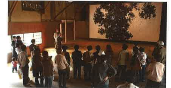
神山アーティスト・イン・レジデンス