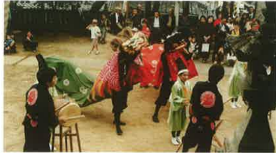
三好市池田町三所神社の川崎獅子太鼓

これまで「あわ文化」について学んできたことに基づいて、なぜ「あわ文化」が長く継承されてきたのか、理由を説明しよう。また、どうすれば「あわ文化」を未来に向けて継承できるか、具体的な方法を提案しよう。