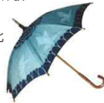
藍染めで製品化された日傘