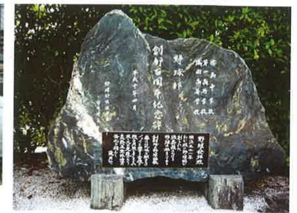
徳島県立城南高等学校野球部創立百周年記念碑