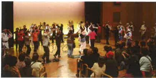
徳島市阿波おどり会館の阿波おどり