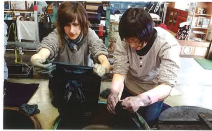
本藍染め矢野工場での藍染体験