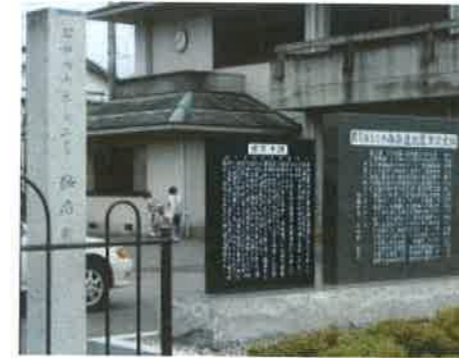
昭和南海地震津波の最高潮位標識