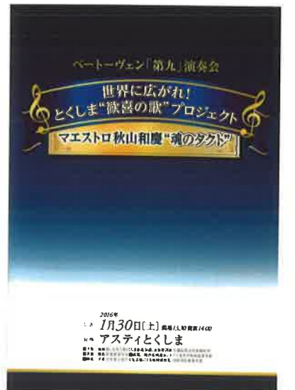
ベートーヴェン「第九」演奏会の パンフレット