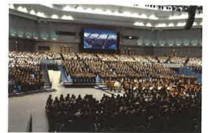
ベートーヴェン「第九」演奏会 「世界に広がれ!とくしま歓喜の歌」 プロジェクト(2016.1.30)

この「第九」アジア初演から70年近くを経た1982年、鳴門で、第1回「第九」交響曲演奏会が盛大に開催されました。その後、この演奏会は、国内外の参加者も増え、日本を代表する「第九」演奏会として、板東俘虜収容所が育んだ人類友愛の精神を世界に発信し続けています。