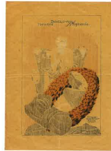
ベートーヴェン「第九」交響曲全曲 コンサートプログラム表紙(鳴門市ドイツ館所蔵) 1918(大正7)年6月1日開催