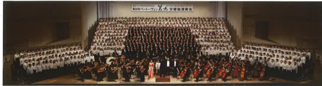
ベートーヴェン 「第九」交響曲演奏会 (NPO法人鳴門「第九」 を歌う会)

なぜ徳島が「第九」アジア初演の地となったのだろうか、その歴史的背景を説明しよう。