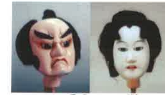
阿波木偶人形の頭