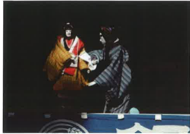
『傾城阿波の鳴門』順礼歌の段より

阿波人形浄瑠璃は、どのように徳島の人々の暮らしに根付いていったのだろうか、具体的に例示し、知識を深めよう。