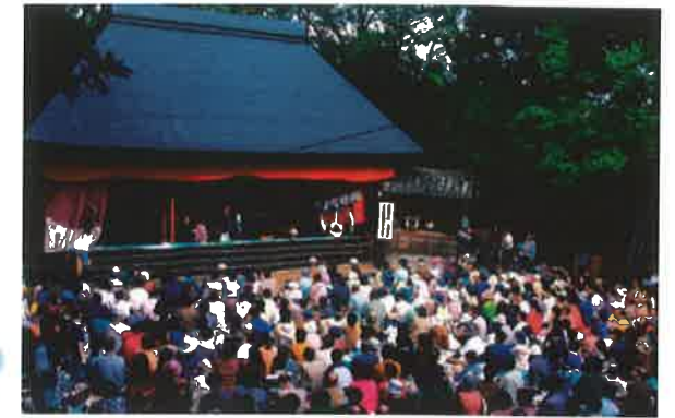
農村舞台 (国指定重要有形民俗文化財・犬飼(徳島市八多町)の舞台)