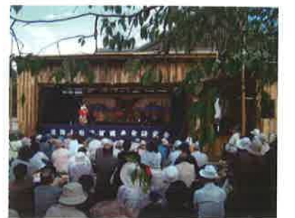
小屋掛け=仮設の舞台 (徳島中央公園)