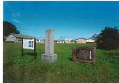
阿波国分尼寺跡(名西郡石井町)