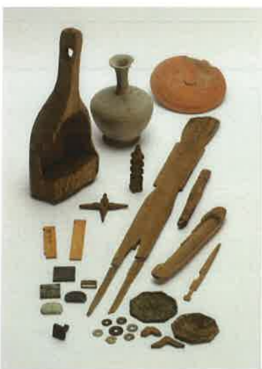
観音寺・敷地遺跡出土品

これらの出土品には、古代地方官庁を運営する上で必要なものがほとんどそろっており、国府の成り立ちや終わり、政治や役人