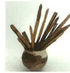
つぼに入った齋串