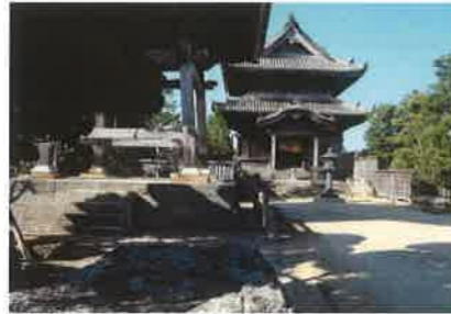
阿波国分寺跡(徳島市国府町)