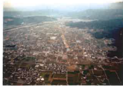
古代阿波国府があったところ (徳島市国府町)

阿波国府周辺から出土した品々を手がかりにして、奈良・平安時代の役人はどのような生活を送っていたのか、資料から読み取り、知識を深めよう。